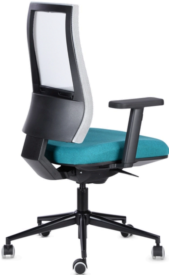
LA PHOTO PEUT INCLURE OPTIONAL